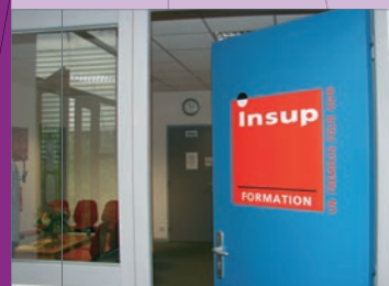
Trois sessions de formation orientation ont été organisées depuis mars 2009 à l'INSUP de Pau.

Coordonné par le conseil régional d'Aquitaine, le programme PRIM2A (Parcours Régionaux Individualisés dans les Métiers de l'Aéronautique en Aquitaine) met en place une offre de formation aux métiers de l'aéronautique pour les demandeurs d'emploi, adaptée aux besoins des entreprises. Une démarche innovante qui bénéficie pour la programmation 2009/2010, soit 700 000 heures de formation, du soutien du FSE à hauteur de 2 852 512 € pour un coût total de 5 705 025 €.