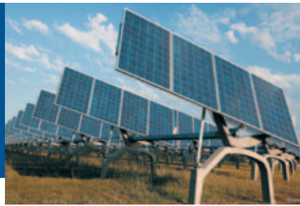
Exotrack, crédit Exosun, L'Exotrack®, suivi solaire conçu par Exosun.

Un secteur de niche, porteur d'emplois Challenge à la fois technique et économique,